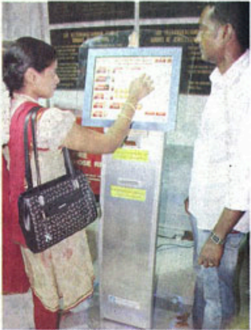
அர்ச்சனைச் சீட்டு, தேவசாய், மூலம், மரணம் பூஜைப் பொருட்களை தானியங்கி இயந்திரத்தில் செலவிட்டு செலுத்துவது குறித்து மின்கல் அலீக்கிரார்.

இந்த வகையில் இங்கு இடம்பெற்றுள்ள இயந்திரத்தை பக்தர்கள் பயன்படுத்துவதால் நேரம் வெலுவதாகக் குறைகிறது. பாஸ், ரெய், மின்கல், தேவசாய் போன்ற பூஜைப் பொருட்கள் யாவையும் இந்த இயந்திரத்தின் மூலம் வாங்கிப்